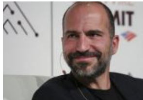
Uber llegará a todas las regiones de...