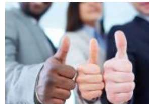
CNN Chile se posicionó dentro de las 10...