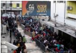
Estadio Víctor Jara funcionará para...

"Lo que Bolivia dice no se apoya con lo que los papeles dicen", explicó el integrante del equipo juridico chileno.