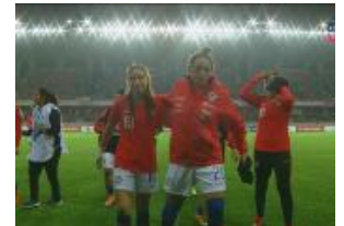
Chile perdió su invicto en la Copa...

/noticia/2018/04/18/estadio-victor-jara- /noticia/2018/04/18/uber-llegara-todas-las- /noticia/2018/04/18/cnn-chile-se-posiciono- /noticia/2018/04/16/perdio-su-invicto-