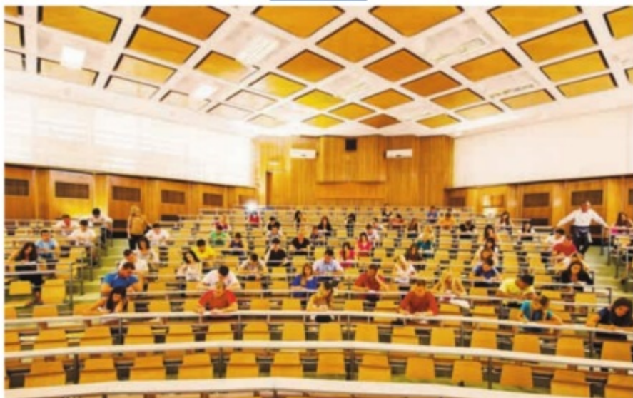
Las firmas ven estos cursos como una forma de que sus abogados se especialicen, aprendan idiomas y trabajen en el extranjero.

Magister , son estudios de posgrado en una universidad anglosajona, de reconocimiento internacional, y que, por regla general, duran un año con dedicación exclusiva.