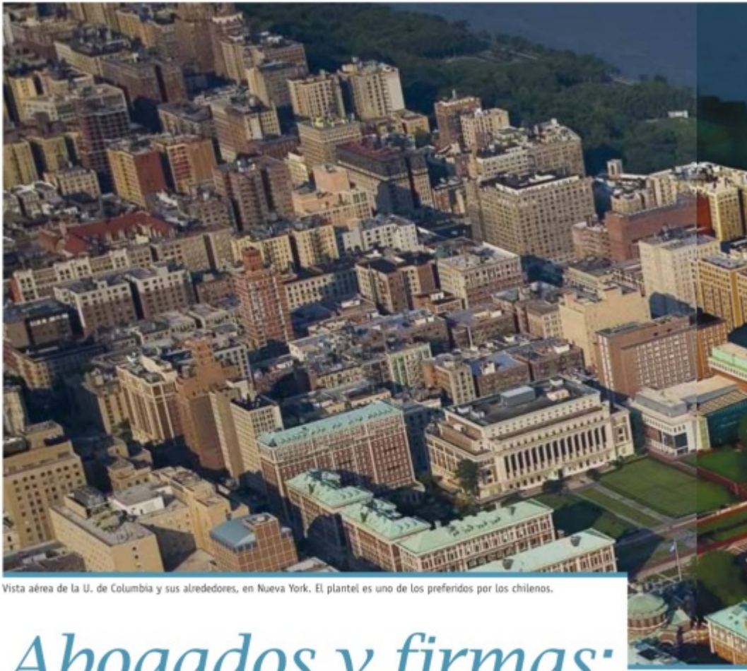
Vista aérea de la U. de Columbia y sus alrededores, en Nueva York. El plantel es uno de los preferidos por los chilenos.